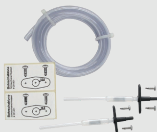
Komplet przyłącza Dp # 54109999