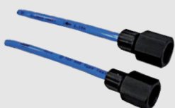
Komplet adaptera uniwersalny # 54210099